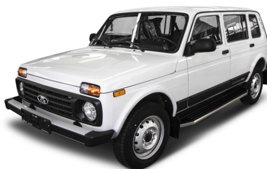
Общий вид автомобиля с порогом