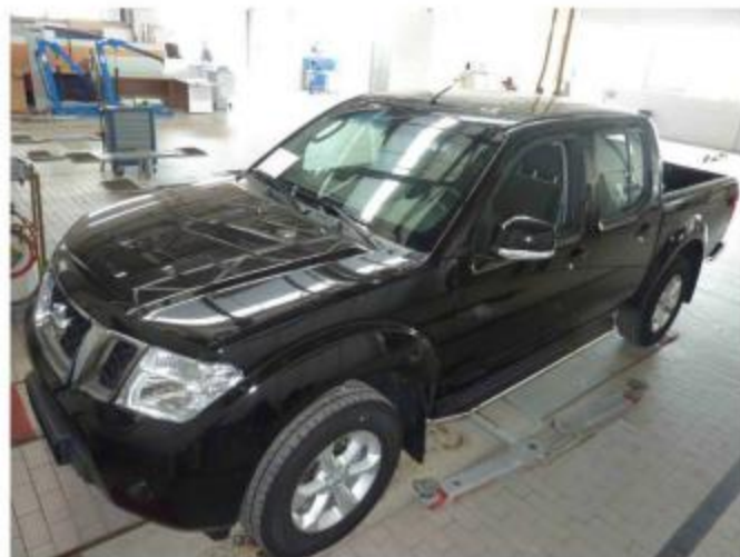
Рис. 5 Вид автомобиля с порогом