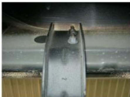
Рис. 3 Установка кронштейна