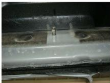
Рис. 2 Место крепления