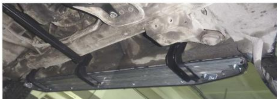
Рис. 4 Вид установленных кронштейнов