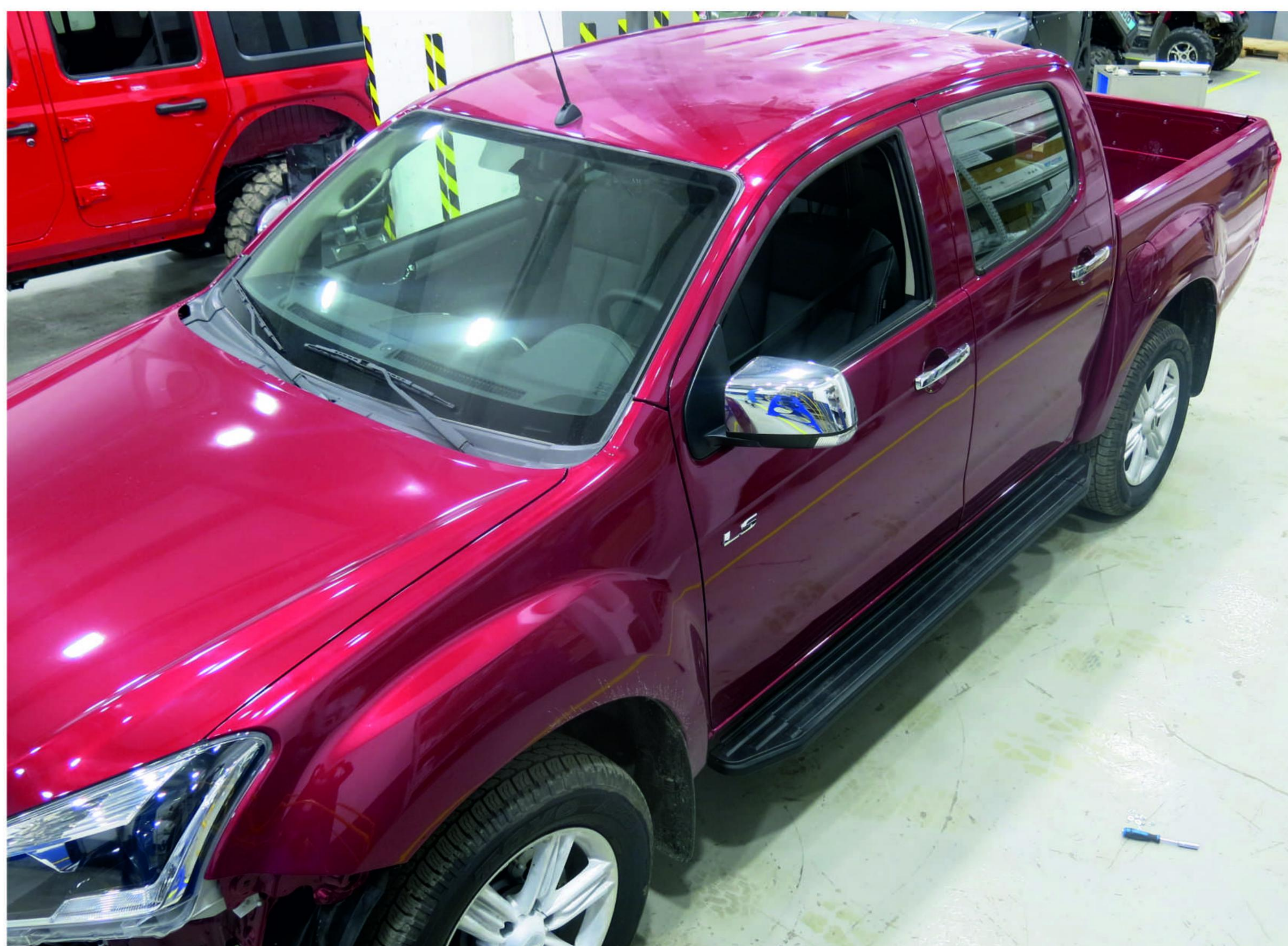
Общий вид автомобиля с порог-площадкой

Перед установкой изделия необходимо убедиться, что автомобиль, на который планируется установка, соответствует модельному ряду, указанному в настоящей инструкции. В случае затруднений с определением соответствия обращайтесь службу технической поддержки supp@rivalauto.com . В случае наезда на препятствие необходимо убедиться в отсутствии повреждений и агрегатов автомобиля и пригодности дальнейшей эксплуатации порогов. При правильной установке пороги не должны касаться узлов и агрегатов автомобиля. Производитель вправе вносить изменения в конструкцию порогов.