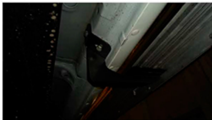
Рис.3 Установка заднего кронштейна в средней части порога автомобиля.