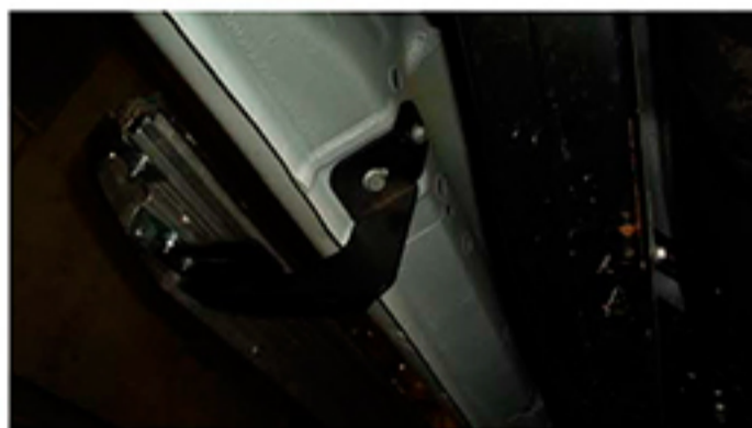
Рис.4 Установка заднего кронштейна в задней части порога автомобиля.