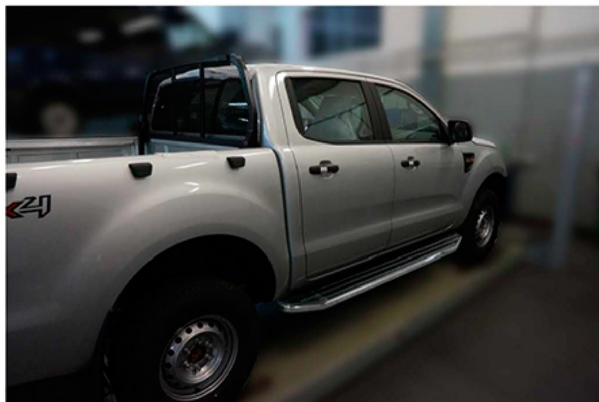
Рис.5 Вид автомобиля с порогом