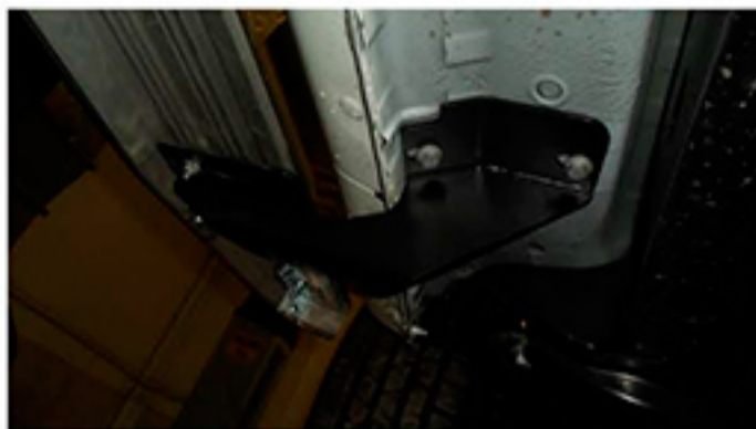
Рис.2 Установка переднего кронштейна в передней части порога автомобиля.