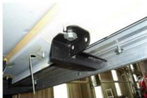
Рис.7 Установка среднего кронштейна