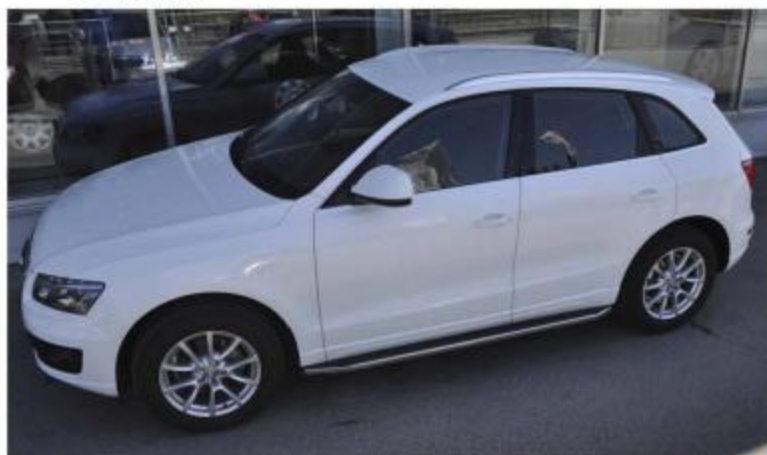
Рис.10 Вид автомобиля с порогом