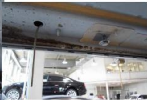
Рис.3 Место крепления среднего кронштейна