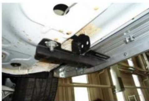
Рис.6 Установка переднего кронштейна