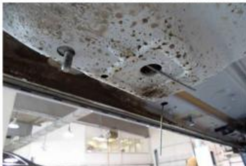
Рис.2 Место крепления переднего крепления