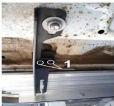
Рис.4 Разметка крепёжных отверстий