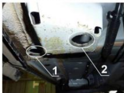
Рис.8 Место крепления заднего кронштейна