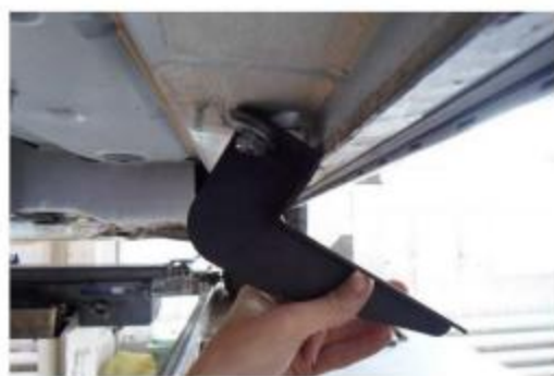
Рис.5 Установка среднего кронштейна