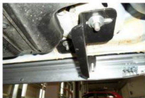
Рис.9 Установка заднего кронштейна