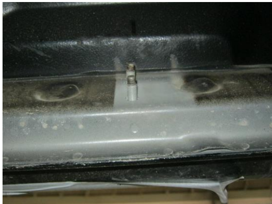
Рис. 2 Место крепления