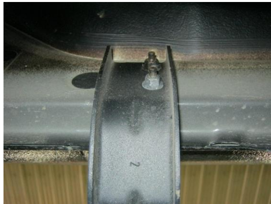
Рис. 3 Установка кронштейна