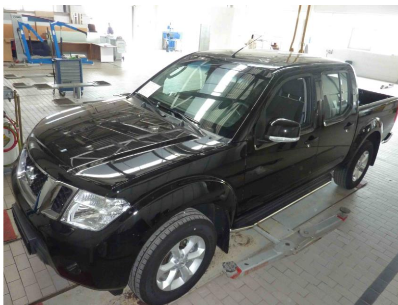
Рис. 5 Вид автомобиля с порогом