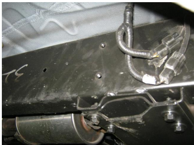
Рис. 2 Место крепления переднего кронштейна справа