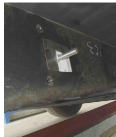
Рис. 7 Установка шпильки закладной М10