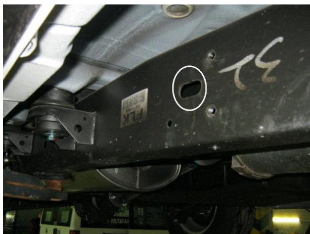
Рис. 5 Место крепления среднего кронштейна