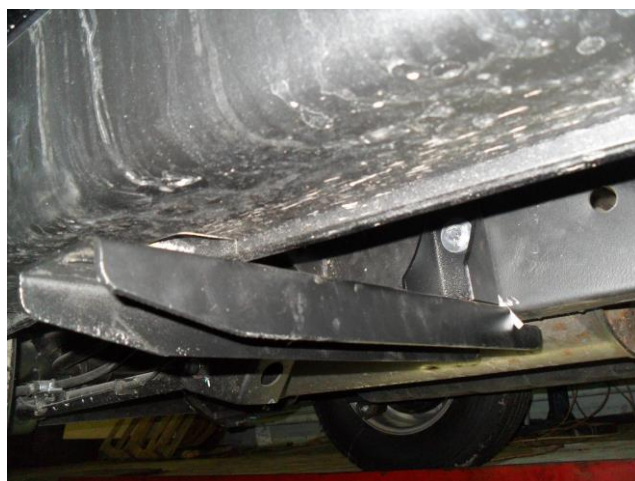
Рис. 9 Крепление заднего кронштейна