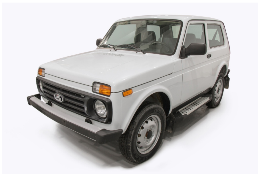
Общий вид автомобиля с порогом