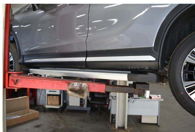
Общий вид автомобиля с порогом

Перед установкой изделия необходимо убедиться, что автомобиль, на который планируется установка, соответствует модельному ряду, указанному в настоящей инструкции. В случае затруднений с определением соответствия обращайтесь службу технической поддержки supp@rivalauto.com . В случае наезда на препятствие необходимо убедиться в отсутствии повреждений и агрегатов автомобиля и пригодности дальнейшей эксплуатации порогов. При правильной установке пороги не должны касаться узлов и агрегатов автомобиля. Производитель вправе вносить изменения в конструкцию порогов.