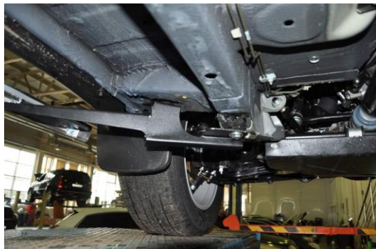
Рис.4 Установка переднего кронштейна