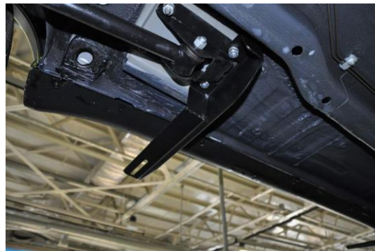
Рис.5 Установка заднего кронштейна